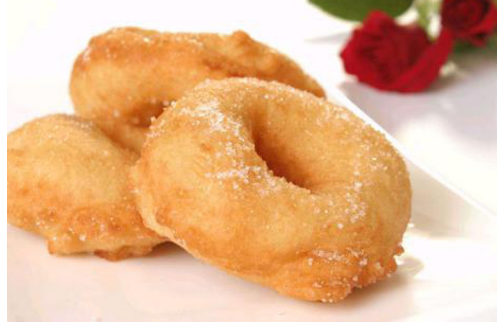
סופגנין הוא הספינג' המרוקאי

הפועל trokto, "כסס, לעס", משום שהיוונים והרומאים נהגו לאכול בעיקר פרות יבשים, אגוזים, גרעינים וגרגרי דגן למנה אחרונה, ומכאן גם הכינוי "כיסנין" בעברית למנה האחרונה, המשמש להלן בסוגיא לב, "הסעודה", לשון קינוח או מנה אחרונה, לשון "כוסס". 26 ואף על פי שהכינויים טרוקטא, טרוקנין ותרגימיא מוסבים בעיקר על פרות ואגוזים, ברבות הימים הם שימשו שמות נרדפים למנה האחרונה כולה, 27 ומכיוון שבארץ ישראל נהגו להגיש גם את המאפים המנויים במשנה חלה א ד, "סופגנין ודובשנין ואסקרטין", במנה זו, אף אלו כונו כיסנין או מיני תרגימא או טרוקטא או טרוגנין. 28