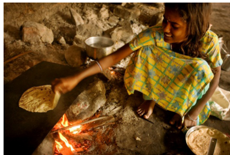
נהמא דהינדקי, לחם מחבת הודי הנקרא צ'פאטי

בלחם העשוי לכותח (פרט לברייתות שבסוגיא שלנו). לעומת זאת, בתוספתא חלה א ז מצאנו את הברייתא שבפיסקא [7] בסוגיא שלנו, אך היא מוסבת על עיסת כלבים ולא על לחם העשוי לכותח: "ר' יהודה או: עיסת כלבים מעצמה נכרת, עשאה ככרין חייבת עשאה לימודין פטורה".